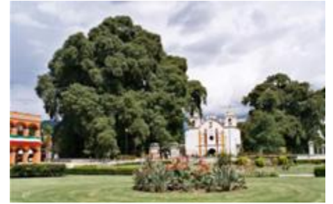
Ahuehuete, Taxodium Mucronatum , Santa María del Tule, Oaxaca, México. Edad: más de 1,000 años. 1 de Julio Día Nacional del Ahuehuete

Localización: México, Guatemala y sur de Texas, EUA.